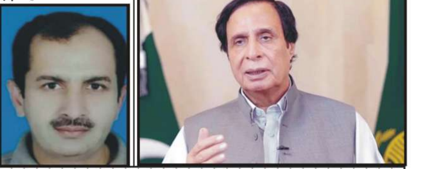
لاہور (ڈیپیک) وزیر اعلیٰ پنجاب

حکومت پنجاب آئین و قانون کے مطابق اپنا کردار ادا کرے گی، نوٹیفکیشن کے بارے میں قانونی اور آئینی راستہ اختیار کیا جائے گا