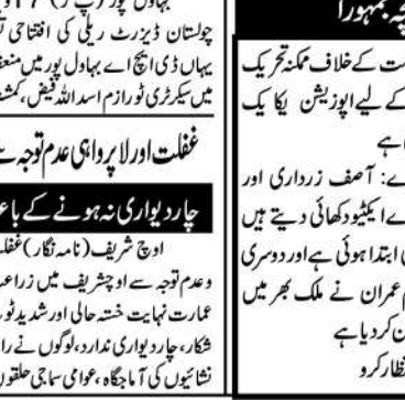
لاہور (این این این) وزیر اعظم عمران خان نے کہا ہے کہ کشمیر پاکستان اور بھارت کے درمیان اہم تنازع ہے تاہم تاریخ سے اس مسئلہ کو بات چیت کے ذریعے حل کر کے چینی دی وئی سی جی جی کی طرف سے حل کرنے کے لیے ضروری ہے۔